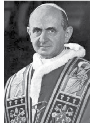
El Papa Pablo VI, autor de la profética encíclica Humanae vitae .

Les pido a mis hermanos sacerdotes que examinen sus propias prácticas pastorales, para asegurarse de que están presentando fiel y persuasivamente la doctrina de la Iglesia sobre estos temas en toda su labor parroquial.