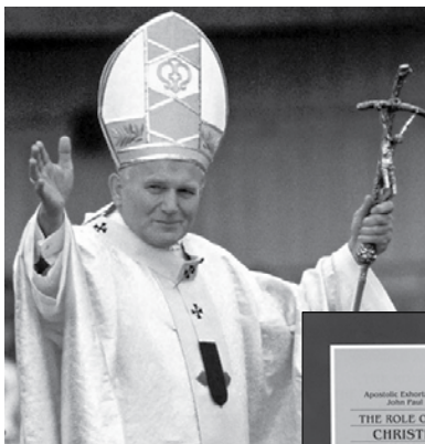
Juan Pablo II presenta la doctrina católica sobre el matrimonio y la sexualidad en su exhortación pastoral Familiaris consortio .