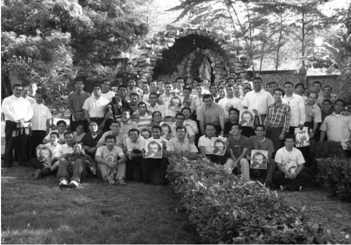
Seminaristas del Seminario Francisco Xavier de Garaicoa, en Guayaquil, Ecuador.